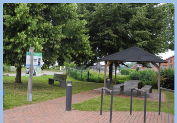
Aufenthaltsplätze im Binnenland